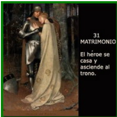
31 MATRIMONIO El héroe se casa y asciende al trono.

Cyriel, el vil mago orgulloso, quedó encerrado en su gruta entre sus mezclas y potingues mágicos, condenado a la oscuridad y la soledad por su soberbia y desalmada ambición.