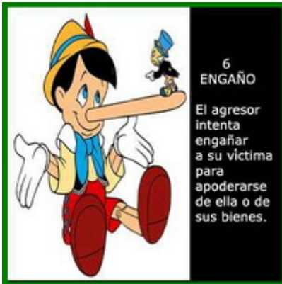
6 ENGAÑO El agresor intenta engañar a su víctima para apoderarse de ella o de sus bienes.

Aetos se presentó como georgio cuyo pueblo gobernado por Alcander el Fuerte era rico y próspero quien, aseguró, mandaría a su poderoso ejército al rescate de sus súbditos amenazados o hechos prisioneros. Aetos reclamó la devolución de su águila, la más poderosa de todas sus aves.