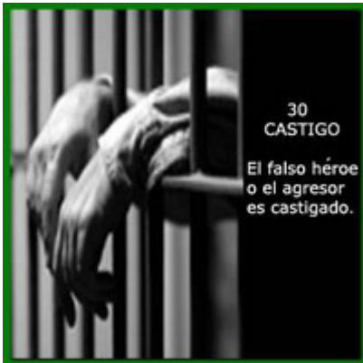
30 CASTIGO El falso héroe o el agresor es castigado.

Aetos, el criador de aves, se convierte en el rey de las aves y recibe del águila imperial el poder de volar.