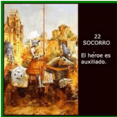
22 SOCORRO El héroe es auxiliado.

Cyril, el mago orgulloso, que vilmente deseaba la muerte de Aetos, pues también codiciaba el águila perdida, había recuperado la soberbia ave del pueblo de los nómadas asustados que la abandonaron, y envió una fuerte tormenta sobre el mar que intentaban cruzar Aetos, el rey y su hija.