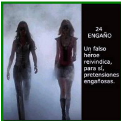
24 ENGAÑO Un falso héroe reivindica, para sí, pretensiones engañosas.

Aetos, Adara y Alcander, llegaron al pueblo de los georgios ahora gobernado por Cyril el mago quien había asegurado la muerte del rey Alcander y su hija bajo la tormenta pasada y en las aguas próximas al pueblo de los nómadas. Alcander y Adara se ocultaron en la granja de Aetos quien reunió a todas sus aves.