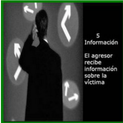
5 Información El agresor recibe información sobre la víctima

Aetos se presentó como georgio cuyo pueblo gobernado por Alcander el Fuerte era rico y próspero quien, aseguró, mandaría a su poderoso ejército al rescate de sus súbditos amenazados o hechos prisioneros. Aetos reclamó la devolución de su águila, la más poderosa de todas sus aves.