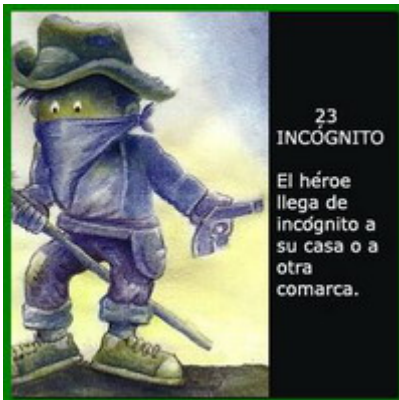
23 INCÓGNITO El héroe llega de incógnito a su casa o a otra comarca.

La embarcación zozobraba peligrosamente sobre olas furiosas y rayos amenazantes. Aetos arrojó al agua el anillo mágico de Cyril el mago cuya maldición se deshizo desapareciendo la tormenta y volviendo las aguas a la calma bajo un cielo luminoso y tranquilo.