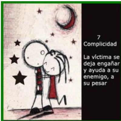
7 Complicidad La víctima se deja engañar y ayuda a su enemigo, a su pesar

Aetos, encerrado y amenazado de muerte por sus guardianes, consiente que Alala se quede con su mascota el águila y promete enseñarla a la diosa guerrera como amaestrar y alimentar a la poderosa águila. De esta forma conservaría su vida haciéndose necesario para el pueblo de los nómadas.