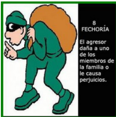
8 FECHORÍA El agresor daña a uno de los miembros de la familia o le causa perjuicios.

Aetos, encerrado y amenazado de muerte por sus guardianes, consiente que Alala se quede con su mascota el águila y promete enseñarla a la diosa guerrera como amaestrar y alimentar a la poderosa águila. De esta forma conservaría su vida haciéndose necesario para el pueblo de los nómadas.