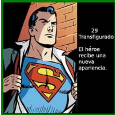
29 Transfigurado El héroe recibe una nueva aparición.

Aetos, el criador de aves, se convierte en el rey de las aves y recibe del águila imperial el poder de volar.